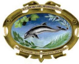
Maison de la Méditerranée

Il Segretario Generale Marrakech, 18 novembre 2022 Prot. 153/2022